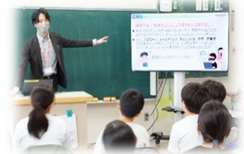
12月19日に実施した情報モラル講座の様子

入井出小学校では、定期的に情報モラル講座を実施しています。これからの社会で情報機器の活用は必要不可欠なものです。しかし、使い方を間違えると大きな問題に発展してしまう危険があります。便利さの裏側にある危険を知ること、危険を予知することができます。御家庭でも話題にさせていただき、使用方法について御確認ください。